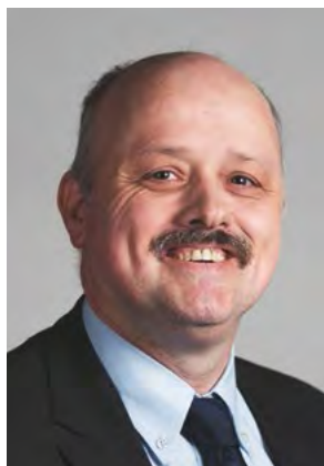
Kläy Dieter (FDP) 2. Vizepräsident Amtsjahr 2017/2018